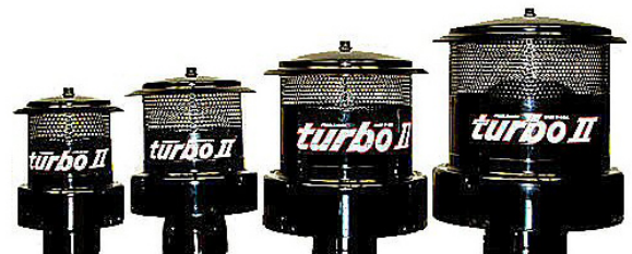
Modèles 24 35-92 KW