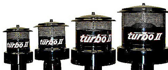
Modèles 24 35-92 KW