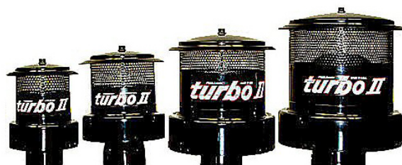
Modèles 24 35-92 KW