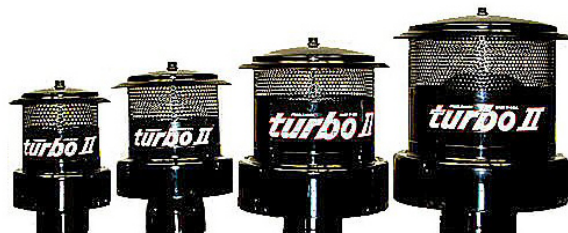
Modèles 24 35-92 KW