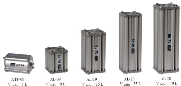
ATF-09 V huiles : 5 L