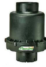
Modèle TB-4.5 Flex In Line 79 - 185 KW