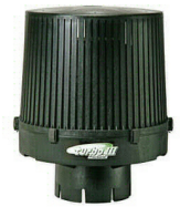
Modèle T3-4.5 73 - 186 KW