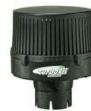
Modèle T3-3 / 4 18 - 93 KW