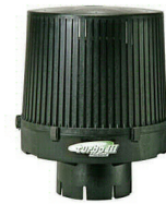
Modèle T3-4.5 73 - 186 KW