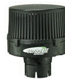
Modèle T3-3 / 4 18 - 93 KW