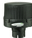
Modèle T3-3 / 4 18 - 93 KW